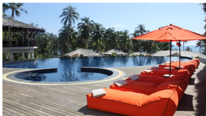
Olcsóság? /6. oldal