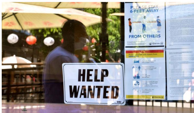
Égető a hiány /4. oldal