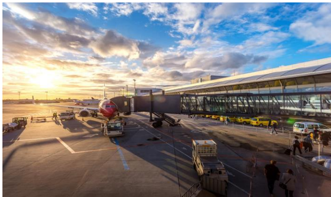
Szellemjáratok /3. oldal

2022. augusztus 26. 18. évfolyam 23. szám