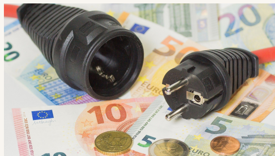
Energiagáz /3. oldal