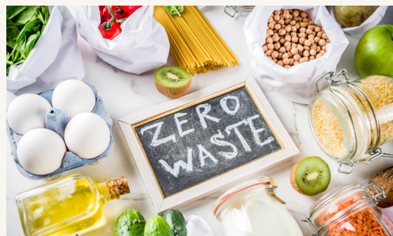
Hulladék /6. oldal