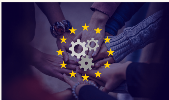
Pact for skills /5. oldal