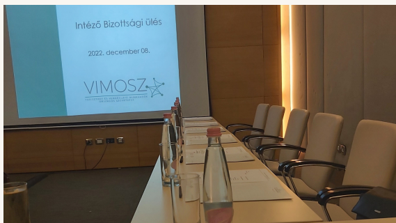
Intéző Bizottsági Ülés /2. oldal

2022. december 16. 18. évfolyam 33. szám