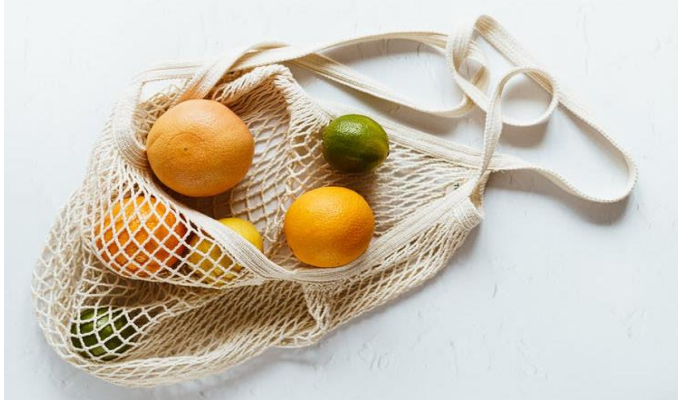
Élelmiszerpazarlás /3. oldal