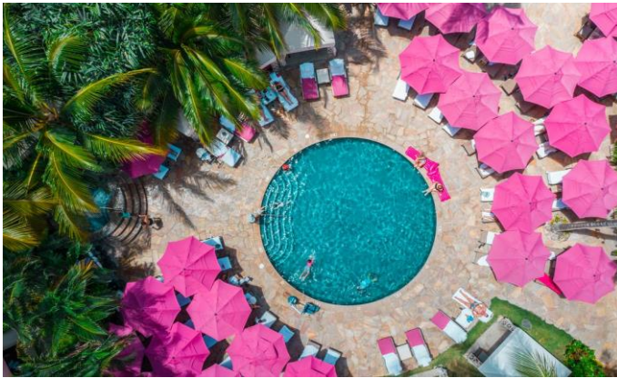
Messze még a vég? /6. oldal