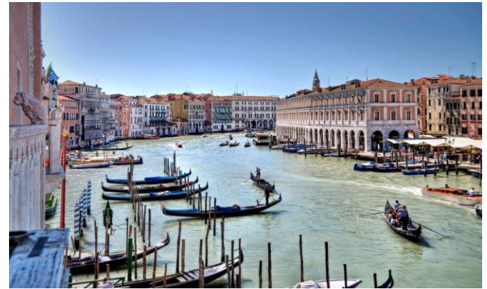
Olasz reakció /8. oldal