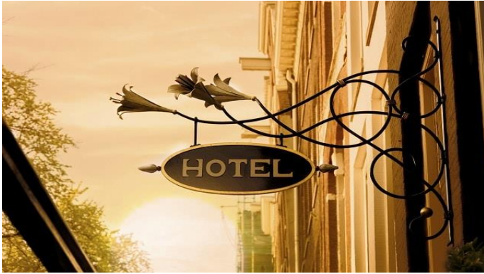
Szállodai benchmarking /3. oldal