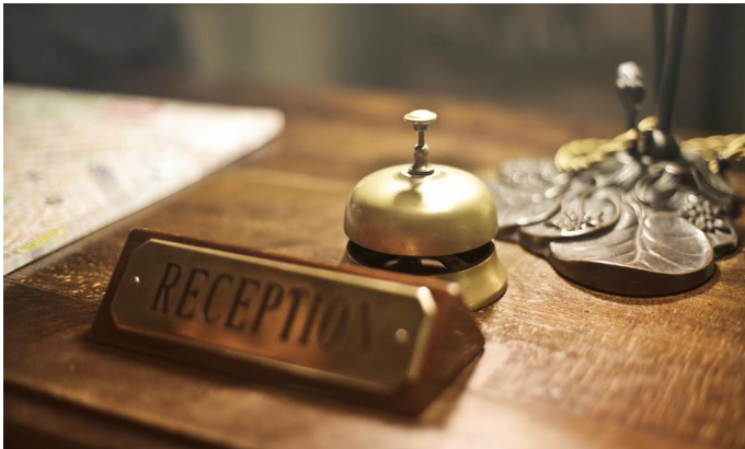
Drasztikus munkaerőhiány /6. oldal