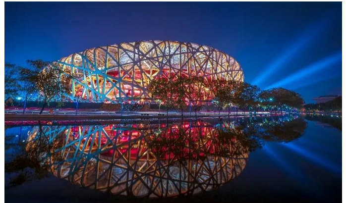
Karantén olimpia /7. oldal