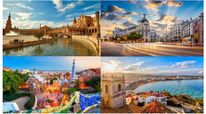
Visszaesés és erősödés jelei /4. oldal