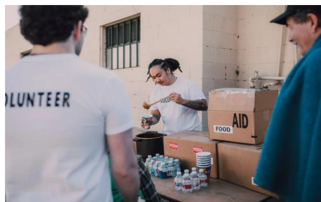
Szegénység Németországban /6. oldal