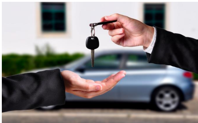
Bérautópiac /2. oldal