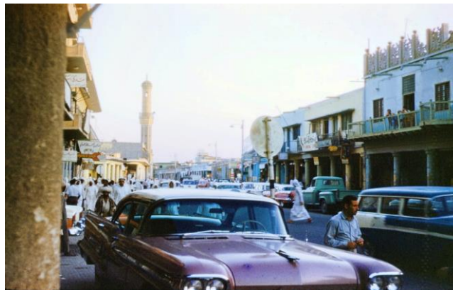
Képzés szaúdiaknak /3. oldal