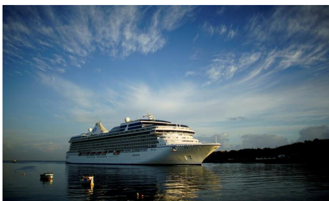
Amerikai hajótársaságok /3. oldal