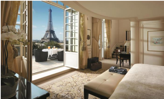
Vissza a 2019-es szinthez /4. oldal