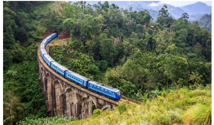
Mindenki a fedélzetre /8. oldal