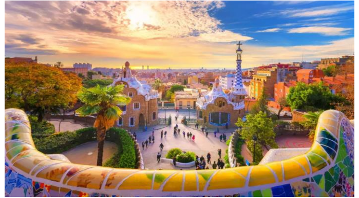
A spanyolok is haladnak /3. oldal