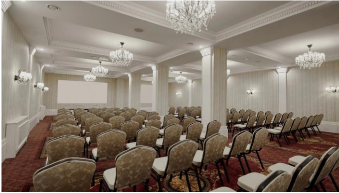
Közgyűlés /2. oldal