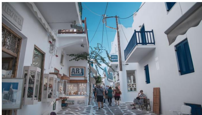
Kapaszkodó görög turizmus /3. oldal