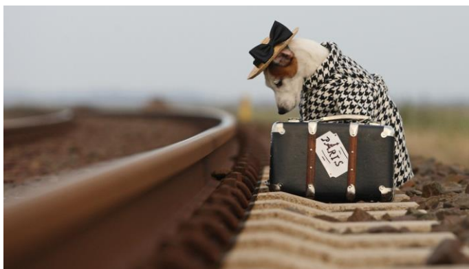
Csökkenő utaselégedettség? /4. oldal