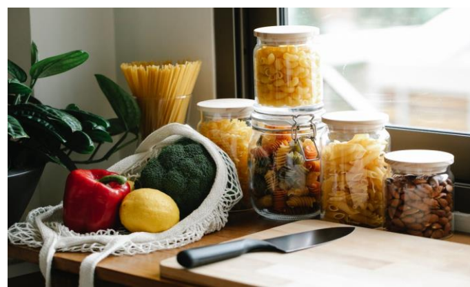
Végleges tápanyagprofilok /8. oldal