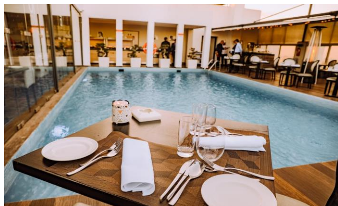
Ázsiai dominancia /6. oldal