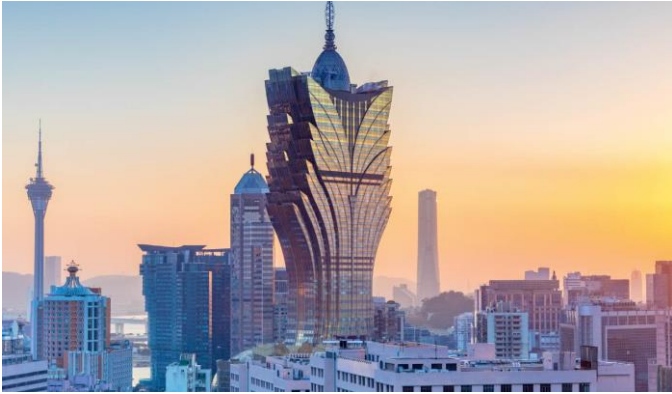
A szerencse terjeszkedik /4. oldal