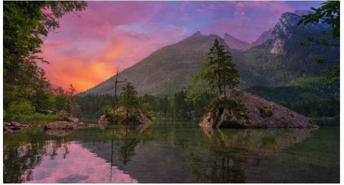
Ausztria /9. oldal