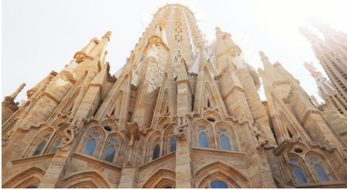
Januári csúcs /8. oldal