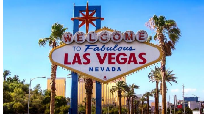
USA ágazati munkaerőhelyzet /6. oldal