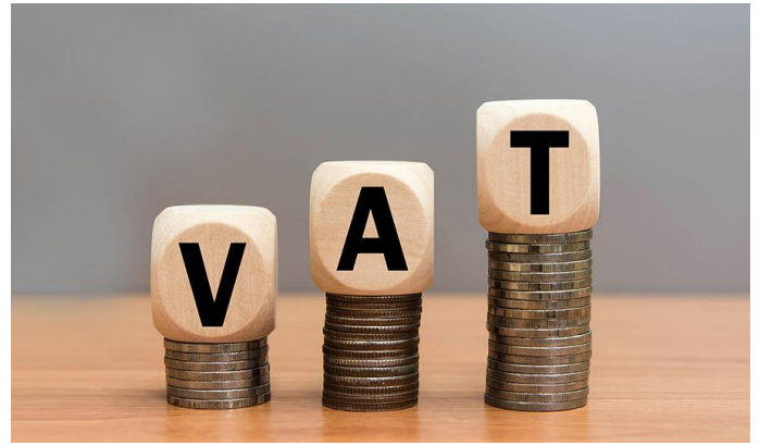
BeaVATkozás /4. oldal