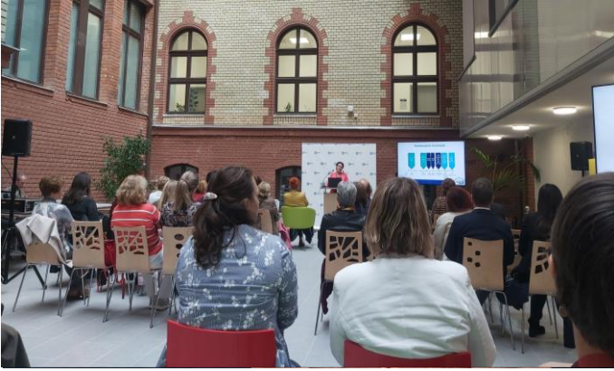
100 éves a dietetikai képzés /2. oldal