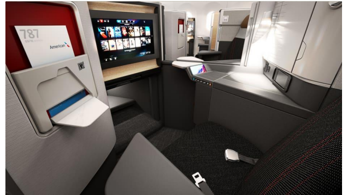
Vége az első osztálynak /7. oldal