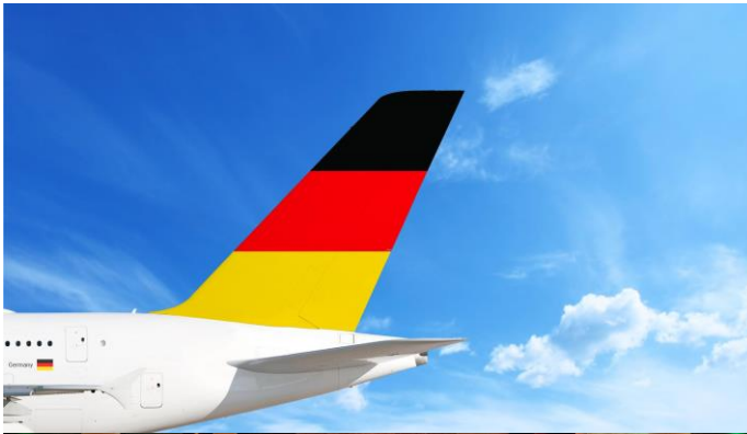
Német statisztikák/5. oldal