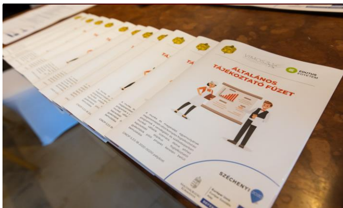
GINOP-210 zárórendezvény /2. oldal

2022. szeptember 20. 18. évfolyam 25. szám