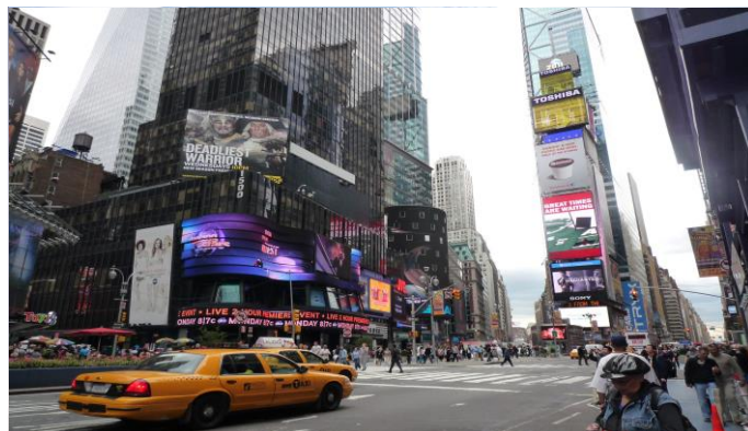
Nagy dobásra készül a Hilton /5. oldal