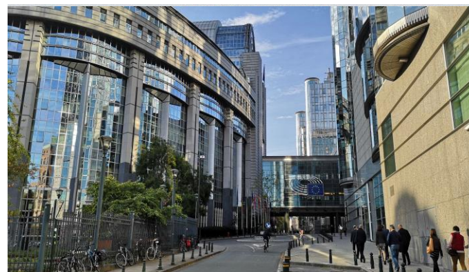
Az Európai Unió üzenete /6. oldal