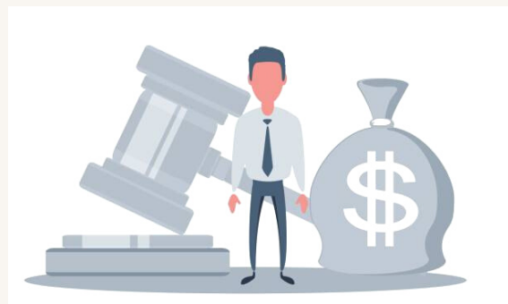
Korrektív törvény /6. oldal