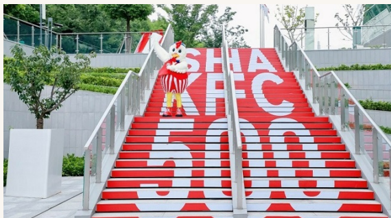
Ez tényleg sok /2. oldal