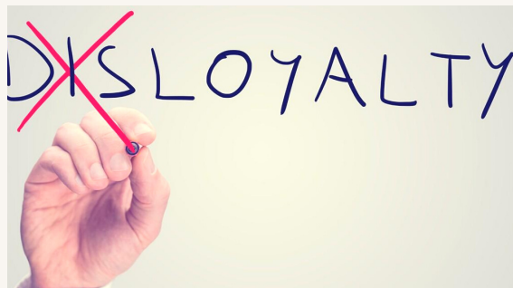
Új hűtlenség program /3. oldal