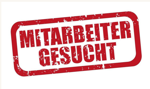
Munkaerő Németországban /5. oldal