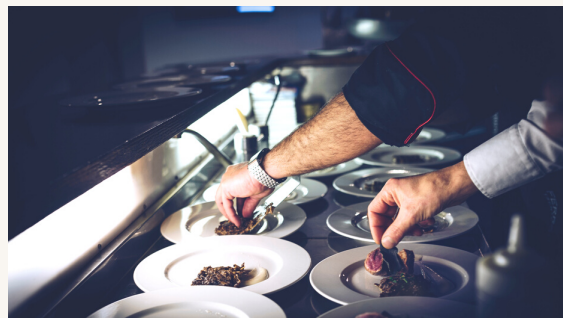
Közétkeztetési Szakácsverseny 2023-2024 /3. oldal