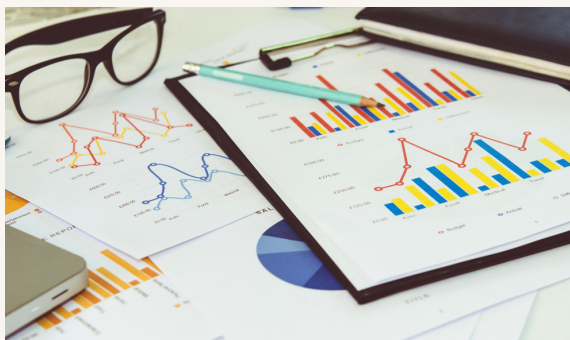
Német helyzetkép /6. oldal