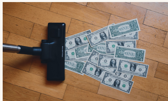
Beruházási boom várható /7. oldal