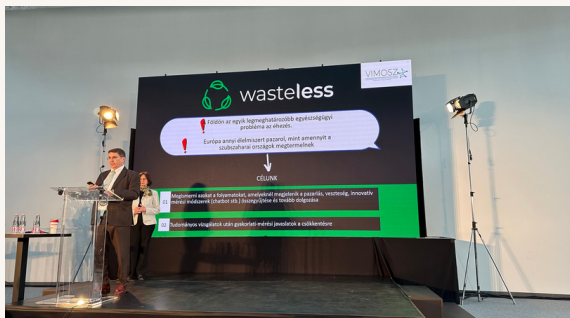
Utazás kiállítás 2023 /2. oldal